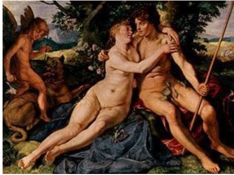
afbeelding 7 ' Venus en Adonis' die Hendrick Goltzius