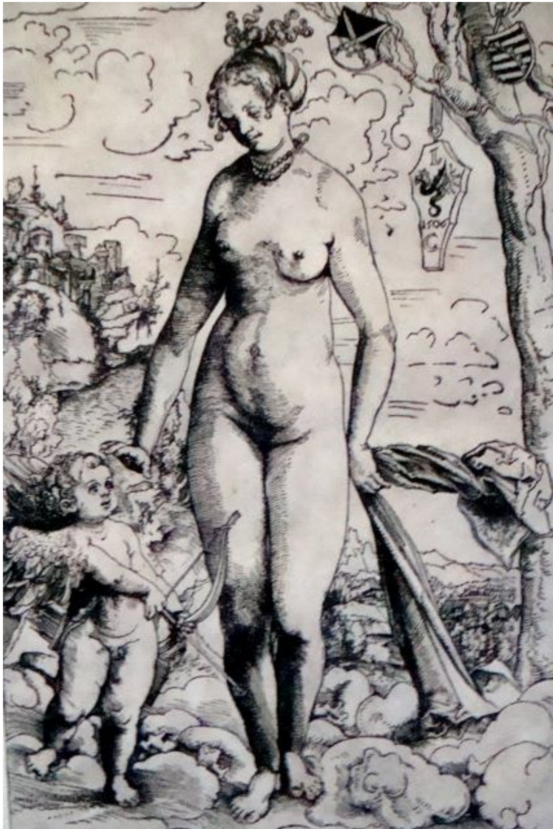
Afbeelding 6 Lucas Cranach Venus en Amor