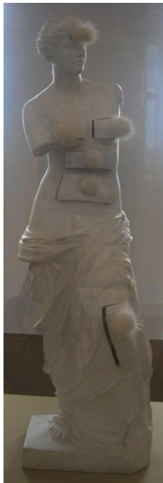
afbeelding 9 'Venus van Milo met laden' van Dali