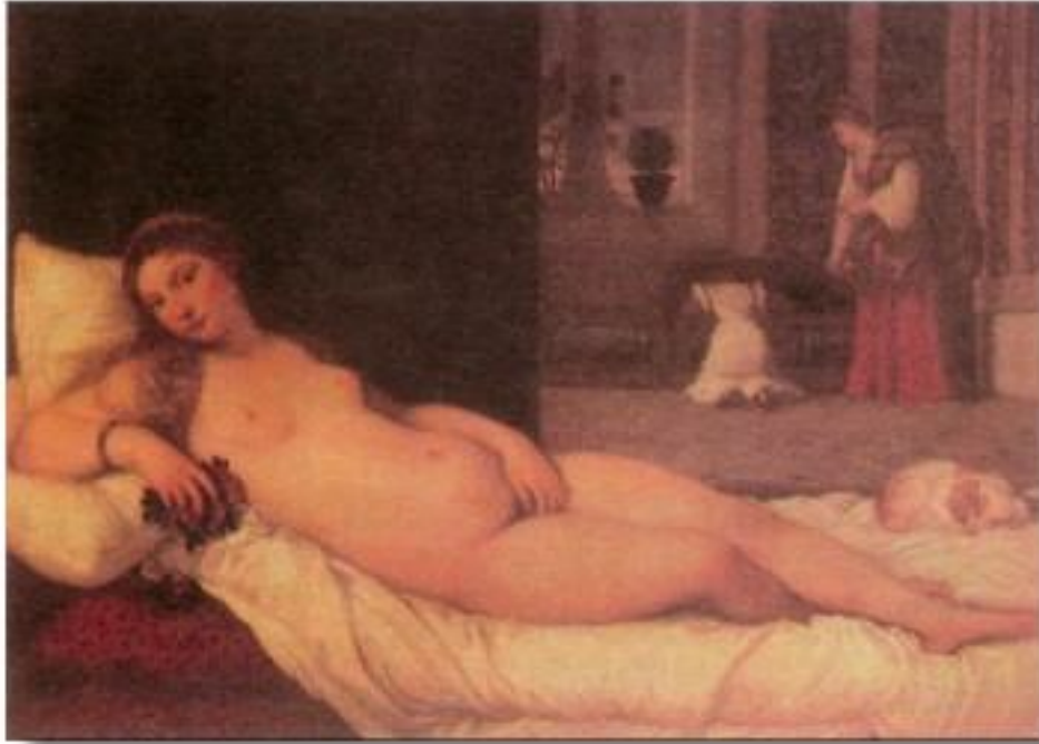
afbeelding 5 Venus van Urbino van Titiaan