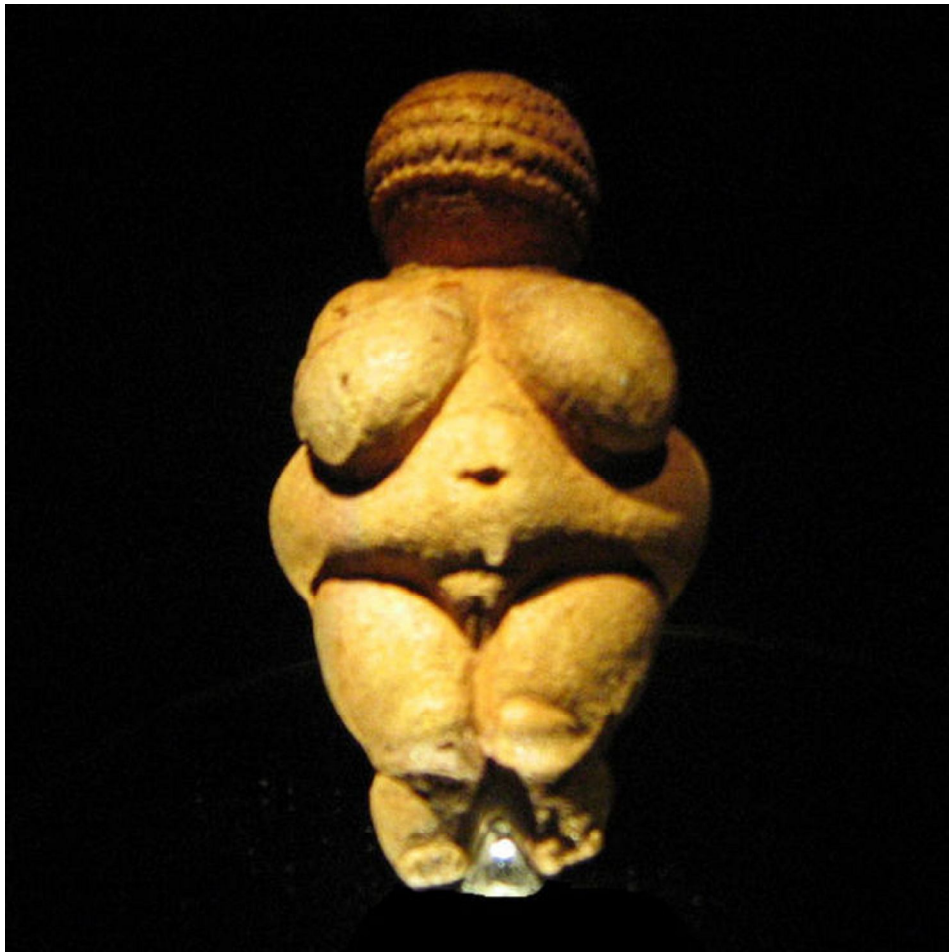
afbeelding 1 venus van willendorf