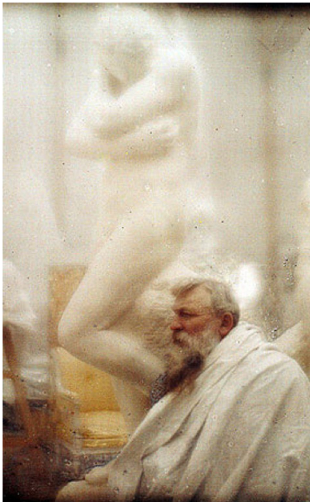
afbeelding 4 Eva met Rodin